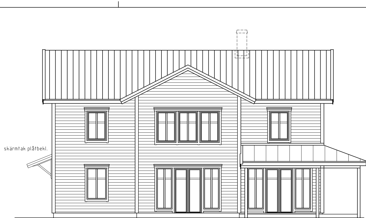
FASAD MOT NORDOST